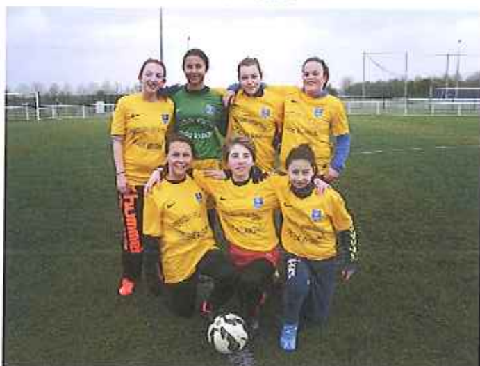
Nos élèves sont championnes d'académie. Félicitations mesdemoiselles !