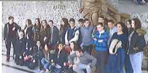
Voyage à Londres Classes de 4ème