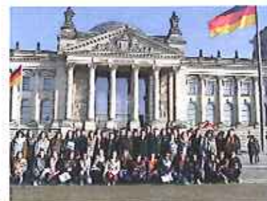
Voyage à Berlin Elèves de 3ème