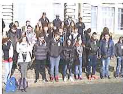
Voyage à Brest Elèves de DP3