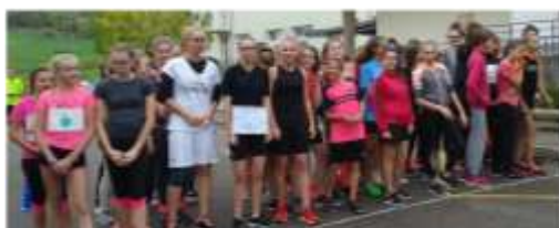
4èmes-3èmes sur le départ