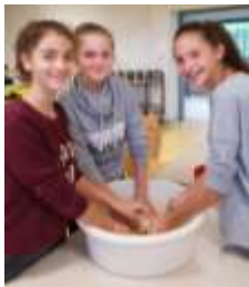
Pétrissage de la pâte à biscuit

Du 9 au 13 octobre, pendant la semaine du goût, les élèves de 5 e ont participé à un atelier pendant deux heures.