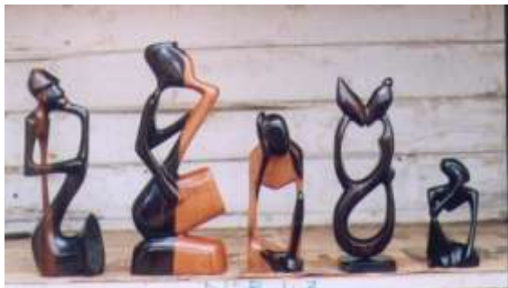
Sculptures togolaises en bois- http://www.enfantsdutogo.fr/img/photos/10.jpg