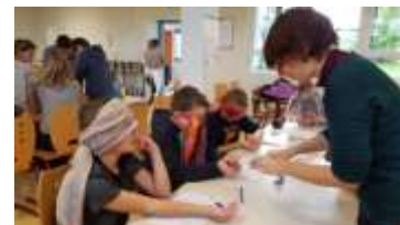
Dégustation à l'aveugle