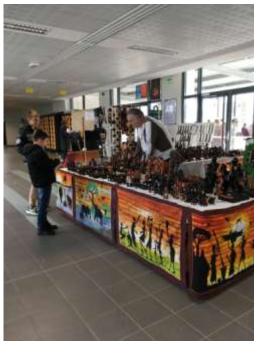
Stand des enfants du Togo au collège.