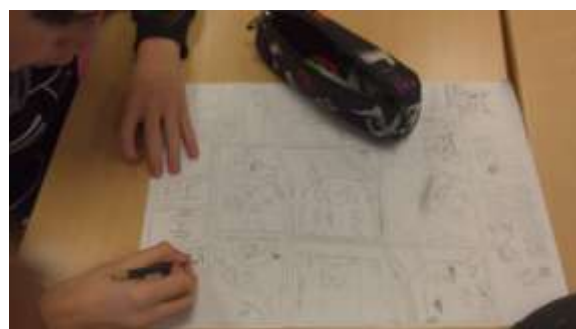
Membre du club, à l'œuvre.

CONCOURS DE LA BD SCOLAIRE à l'école de la bd 2 OCTOBRE 2017 > 5 MARS 2018