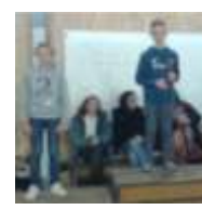
Vainqueurs en 6ème