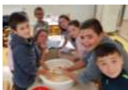
Lecture de la recette et mélange des ingrédients

Chaque classe a fabriqué des gâteaux différents aux sésames, aux pistaches et aux noix qui ont été mangés le midi par l'ensemble des élèves demi-pensionnaires.