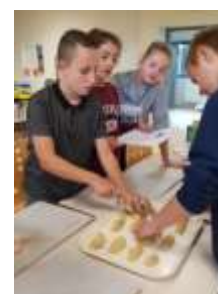
Confection des biscuits