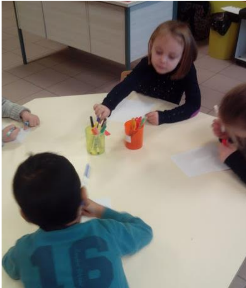
Décoration studieuse des lettres

Pour pouvoir remettre les lettres dans l'ordre, les CP se sont en amont entraînés à remettre des syllabes dans l'ordre, pour fabriquer des mots existants.