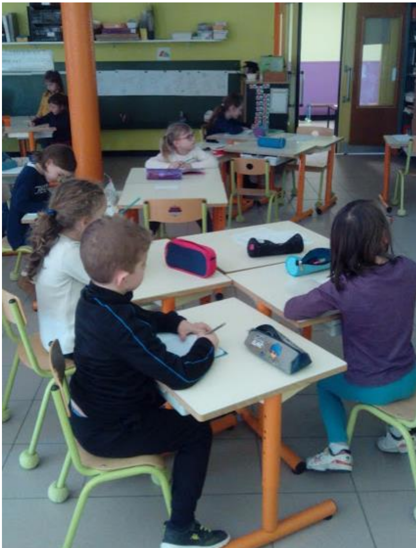
Tout le monde fait preuve de concentration

Après la sortie, en plus de se remémorer le film et de dire les passages que nous avons aimé, les élèves (GS + CP) ont écrit des phrases pour raconter le film à l'aide d'un référentiel construit tous ensemble et codé par les CP.