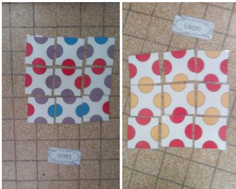
Voici un exemple de « jeu-travail » à disposition dans le coin « quand j'ai fini »

Il faut avoir été blanc comme neige à la première période pour accéder à ce privilège.